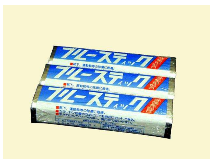
石鹼 (ブルスティック)